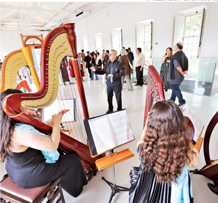
Houve apresentação de harpas durante a inauguração do espaço

tombado pelo Instituto de Patrimônio Histórico Nacional (Iphan), e transformou as ruínas em um moderno centro cultural. A exposição inaugural, ‘Chegança’, tem abertura marcada para novembro e apresentará obras de artistas contemporâneos como Beatriz Milhazes, Aline Motta e Sônia Gomes, além da obra Composição (Figura Só) (1930), de Tarsila do Amaral, entre outras. “O Museu Vassouras é mais do que uma homenagem ao passado: é uma ponte viva com o futuro, promovendo cultura, educação e turismo para todo o nosso estado. Um exemplo de iniciativa a ser seguida por outros municípios”, destacou Cláudio Castro. Nas redes sociais, Eduardo Paes definiu o que representava a chegada do novo museu: “Um presente para o Rio de Janeiro.” Com programação educativa já iniciada desde janeiro e expectativa de intensa ativi-