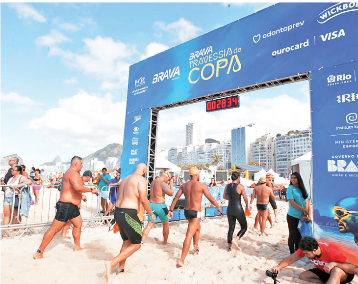
As largadas das provas aconteceram em dois pontos diferentes

Ele completou 54 anos ontem e celebrou em grande estilo, fazendo a distância de 1,5 km. Nadador experiente, o morador de Juiz de Fora (MG) classificou o mar de Copacabana como imprevisível. “Cada vez que eu venho o mar está diferente”. Ele tem paralisia desde os 3 anos, mas ressalta que a deficiência nunca o impediu de fazer nada. “Graças a Deus, eu tive muito incentivo para poder ter uma vida profissional e pessoal. Na área esportiva, como eu gosto muito de nadar, nunca foi um problema”.